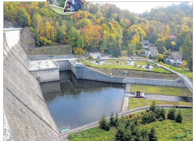
Dieses Ensemble von der Wendefurthertalsperre aus hat Dirk Schmidt aus Thales Ortsteil Altenbrak mit seiner Kamera eingefangen.