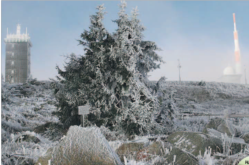
Rüdiger Strutz aus Elbingerode ist auf dem Brocken dem Winter begegnet, während unten in den Tälern noch der Herbst die Landschaft in bunte Farben taucht.

Halberstadt (im) • „Werde fit für die Bewerbung“ heißt es heute ab 13 Uhr bereits zum dritten Mal in der Agentur für Arbeit Halberstadt, Schwanebecker Straße 14. Von 13.15 bis 13.45 Uhr präsentieren Auszubildende der Behörde bei einer Modenschau passende Bekleidung für Vorstellungsgespräche und Fotos. An vier verschiedenen Marktständen gibt es zwischen 13.45 und 15 Uhr Frisuren- und Kosmetikberatung. Zudem können dort die Bewerbungsunterlagen überprüft werden lassen. Ab 15 Uhr geben Berufsberater der Agentur Tipps zum Thema der Veranstaltung und bieten Berufswahltests an. Anmeldungen und nähere Auskünfte sind im Berufs-Informations-Zentrum, unter Telefon (0 39 41) 4 01 16 oder unter halberstadt.biz@arbeitsagentur.de möglich.