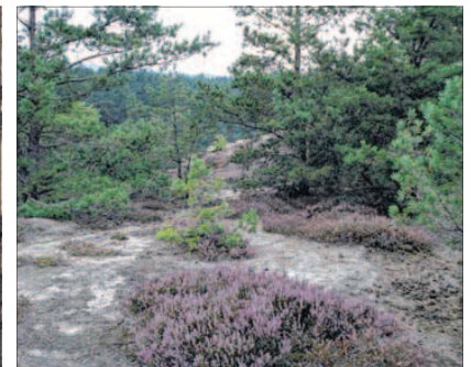
Ein Fleckchen Heide im Harz hat Christel Schmeer aus Blankenburg im Heers unterhalb der Burg Regenstein entdeckt.